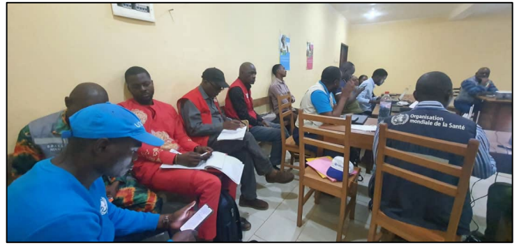
Image : Réunion de coordination du comité technique du 28 juillet 2023.