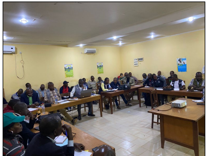
Tenue de la réunion technique de coordination journée du 29 juillet