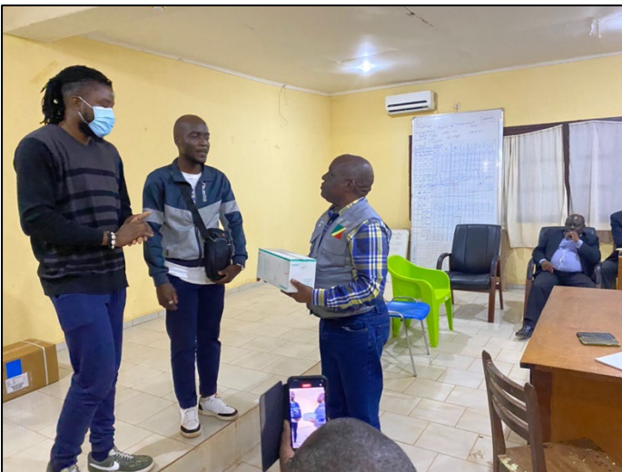
Remise d'un don de médicament d'une valeur de 600 milles par les enfants de Dolisie