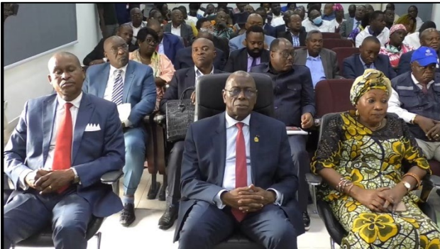
Point de la situation épidémiologique dans les départements de Pointe-Noire et du Kouilou devant le ministre de la santé et de la population

DATE DE NOTIFICATION DU 1 er CAS : 28 Juin 2023 PERIODE RAPPORTEE : 29 Juillet 2023 DATE DE PUBLICATION : 31 Juillet 2023